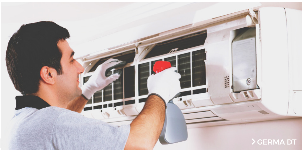
> GERMA DT